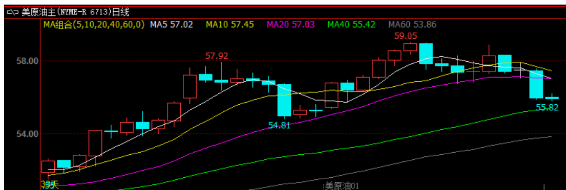
图1：WTI原油期货价格走势

隔夜，欧美原油期货宽幅回落，周三(12月6日)WTI原油1月期货结算价每桶55.96美元，比前一交易日下跌1.66美元，跌幅2.9%，交易区间55.87-57.57美元；布伦特原油2月期货结算价每桶61.22美元，比前一交易日下跌1.64美元，跌幅2.6%，交易区间61.16-62.93美元。受到原油期货的带动，沥青期货开盘大幅跳水，全交易日一路下探。